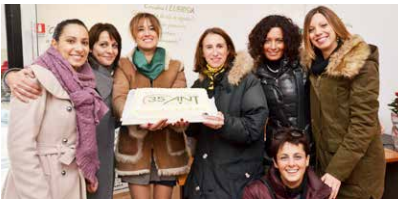
Nella foto un momento dell'inaugurazione della nuova sede ANT a Perugia.

Il mio incontro con ANT avviene per caso alla fine di agosto del 2011, in occasione di un seminario sulle cure palliative. Ho conosciuto il dolore e lo smarrimento derivati dalla malattia oncologica, quindi mi accosto alla Fondazione e mi affascina la parola “Eubiosia”, soprattutto il modo in cui viene attuata. Questo modello di assistenza manca nella mia Regione, così scelgo col cuore di attivarmi per far sì che il credo di ANT possa diventare una concreta realtà e nel maggio 2012 il Consiglio d'Amministrazione della Fondazione delibera la costituzione della Delegazione Umbra – Provincia di Perugia, designandomi delegata.