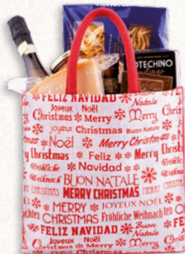
PANIERE DELLE ECCELLENZE Cod.015

(L'immagine è puramente indicativa: i prodotti raffigurati possono subire modifiche)