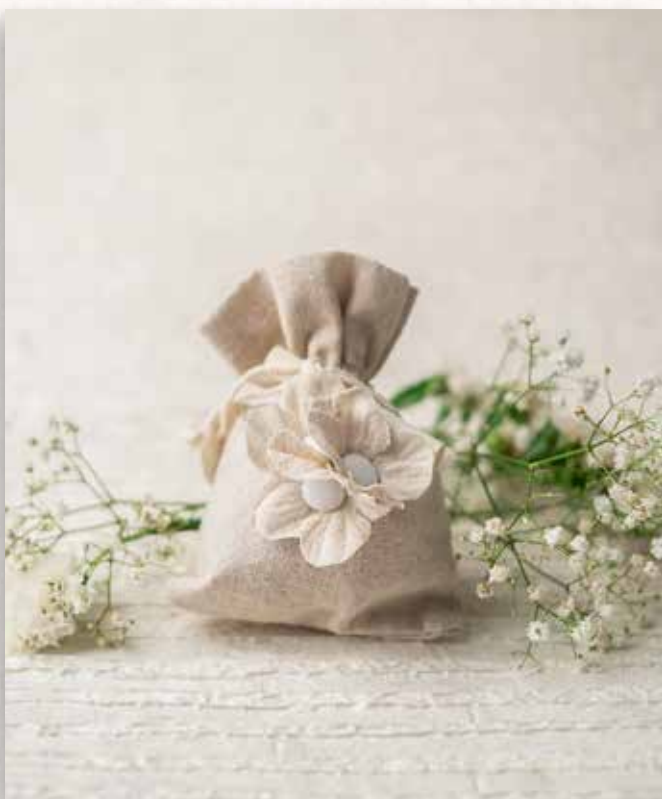
A4 SACCHETTO con FIORI Formato 10x14 cm. € 5,00 cad.