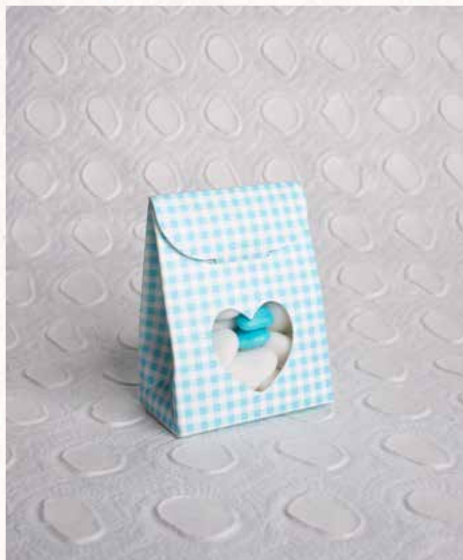
C4 SCATOLINA QUADRI AZZURRA Formato 6x3,5x6 cm. € 3,00 cad.