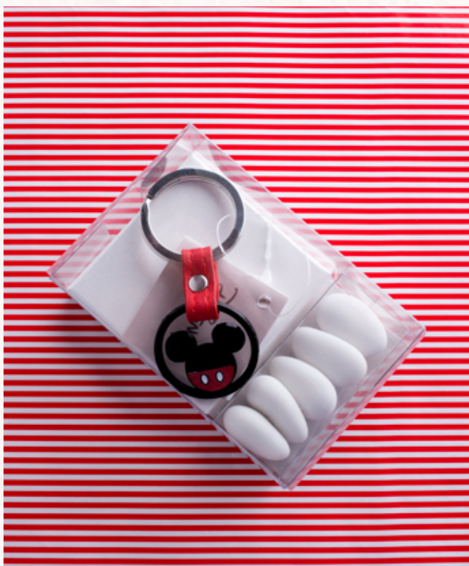
B9 PORTACHIAVI MICKEY MOUSE con blister portaconfetti € 8,00 cad.