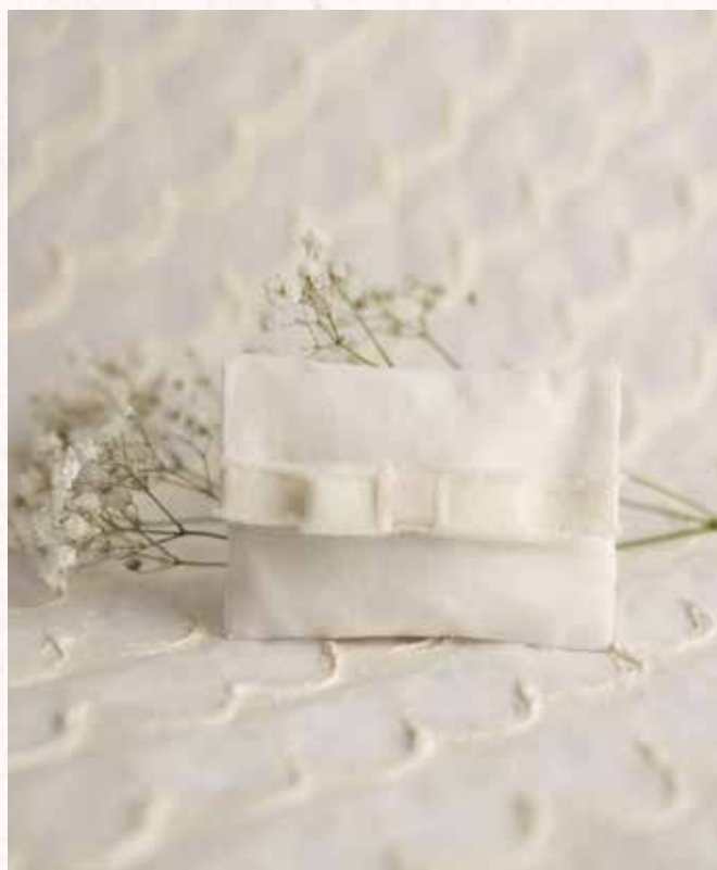
B6 BUSTINA CON NASTRINO Formato 10x7,5 cm. € 5,00 cad.