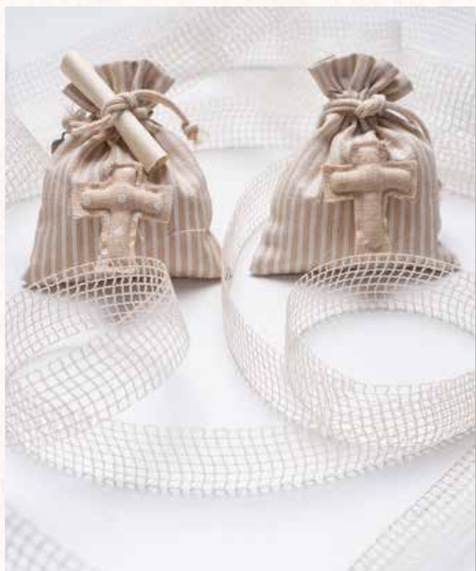
A9 SACCHETTO con CROCE Formato 10x12 cm. € 5,00 cad.