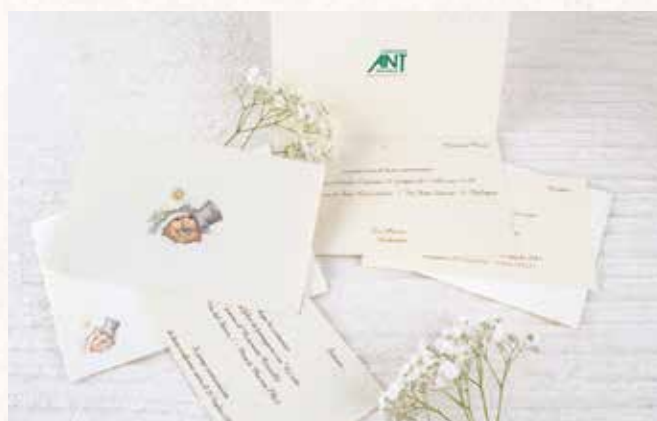
Partecipazioni di Nozze offerta 3€ cad.