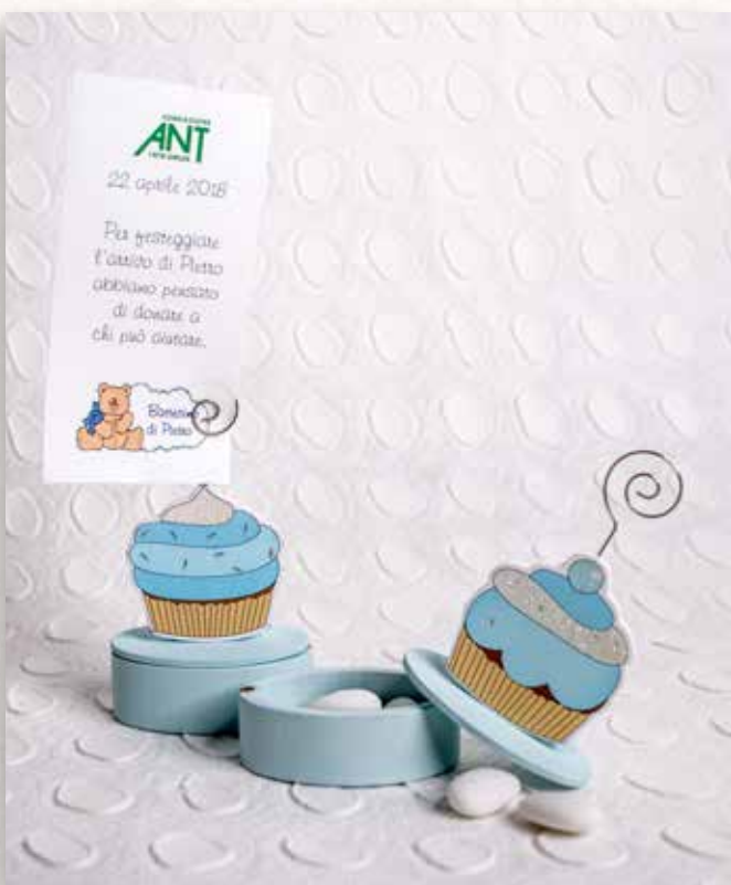
C7 CUPCAKES SEGNAPOSTI Offerta minima € 5,00 cad.