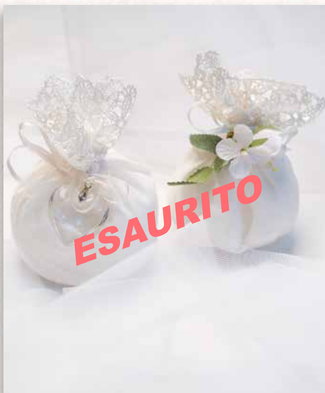
A3 SACCHETTO MACRAMÈ Formato 8,5x13 cm. € 5,00 cad.