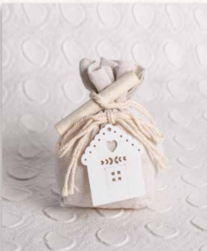
C2 SACCHETTINO con CASETTA Formato 6x11 cm. € 5,00 cad.