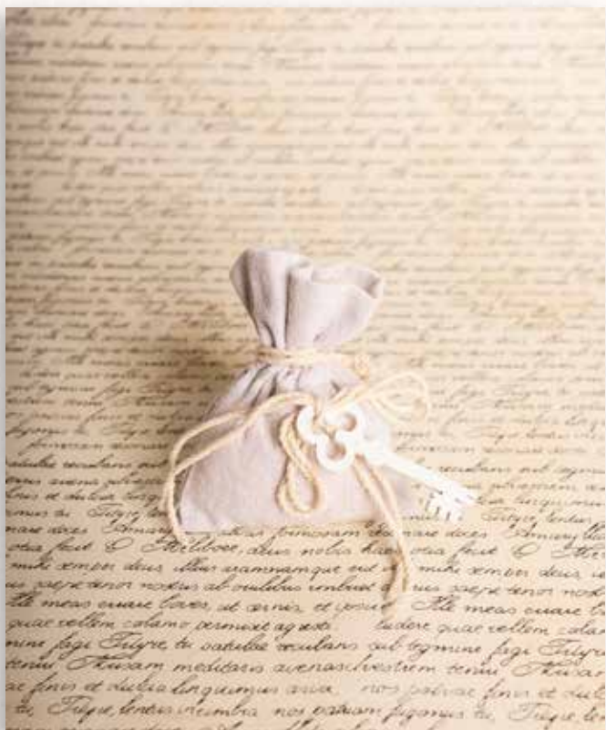
C1 SACCHETTINO con CHIAVE Formato 8x10 cm. € 5,00 cad.