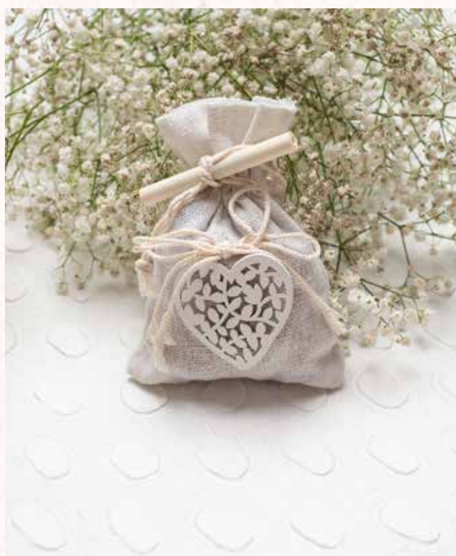
A10 SACCHETTO con CUORE Formato 10x14 cm. € 5,00 cad.