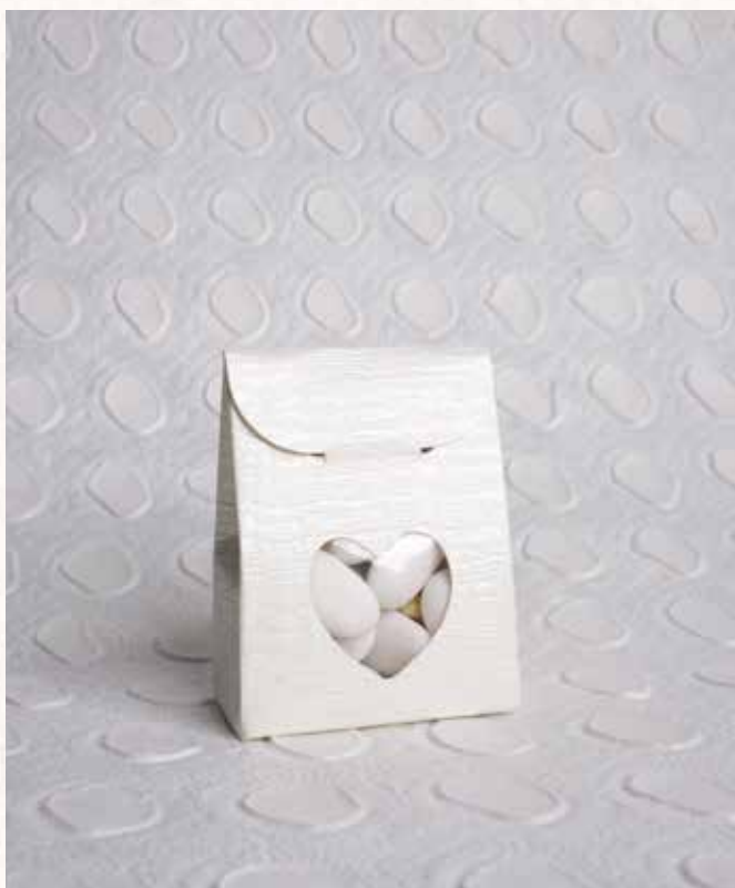
B3 SCATOLINA CUORE AVORIO Formato 6x3,5x6 cm. € 3,00 cad.