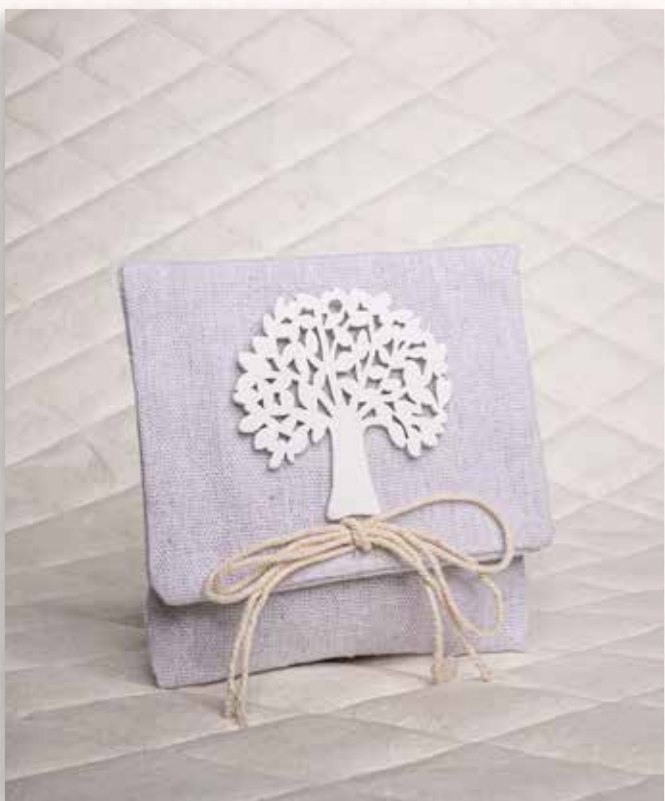
B5 BUSTINA ALBERO VITA Formato 10x12 cm. € 5,00 cad.