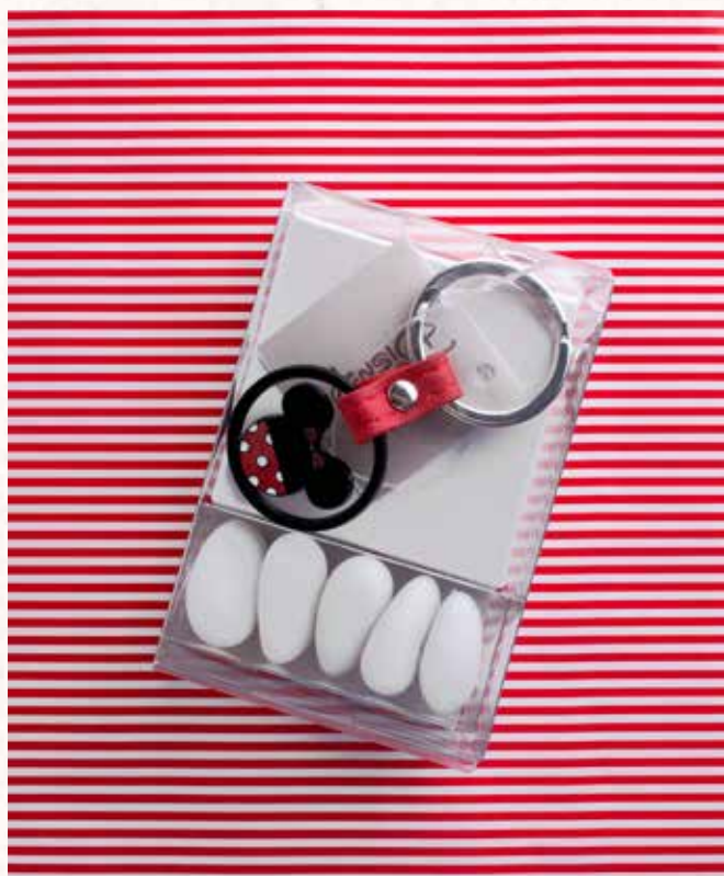
B10 PORTACHIAVI MINNIE con blister portaconfetti € 8,00 cad.