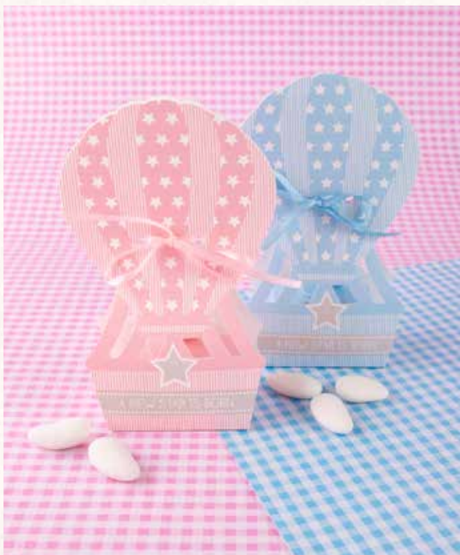
B1-B2 SCATOLINA MONGOLFIERA Formato 6x4x14 cm. € 3,00 cad.