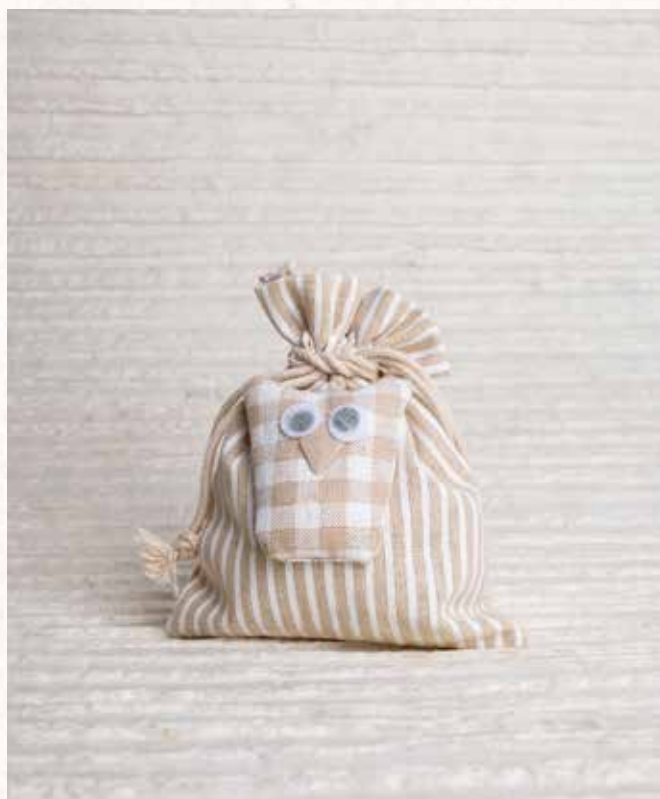
A5 SACCHETTO con GUFETTO Formato 10x12 cm. € 5,00 cad.