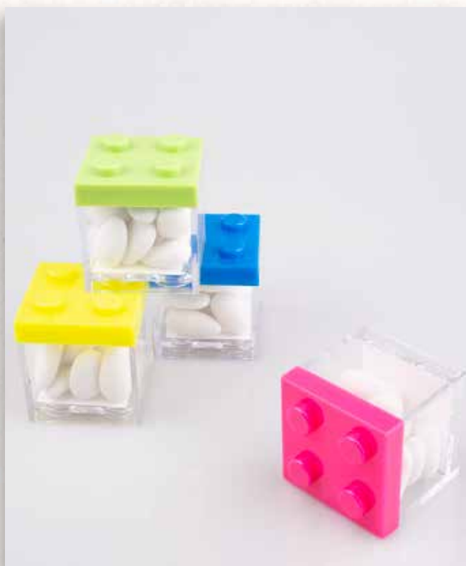
C5 CUBI PORTACONFETTI Formato 5x5x5 cm. € 4,00 cad.