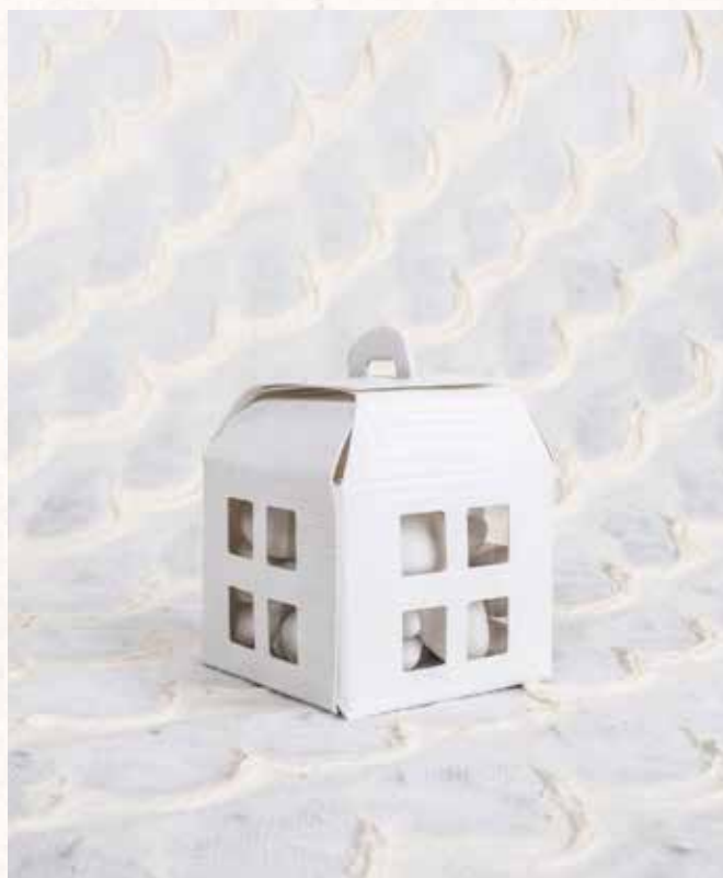
B4 SCATOLINA LANTERNA Formato 5,5x5,5x7,5 cm. € 3,00 cad.