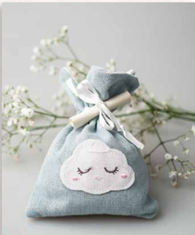
A2 SACCHETTO con NUVOLA Formato 11x14 cm. € 5,00 cad.