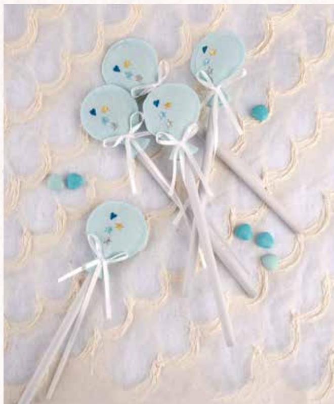
B8 MATITA PALLONCINO AZZURRA Offerta minima € 3,00 cad.