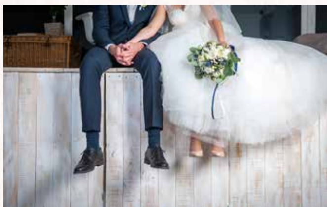
Matrimonio, Unione Civile e Anniversario