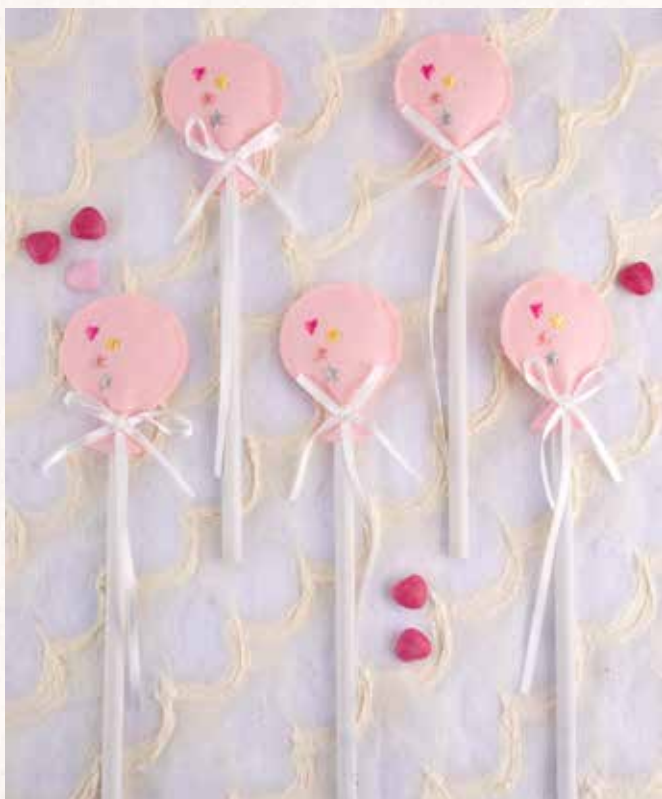
B8 MATITA PALLONCINO ROSA Offerta minima € 3,00 cad.