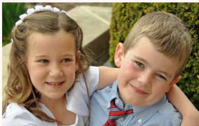
Prima Comunione e Cresima