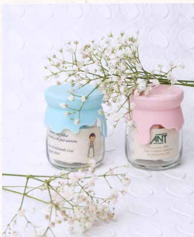
C9-C10 BARATTOLINI in VETRO Disponibili solo per Bologna e provincia € 5,00 cad.