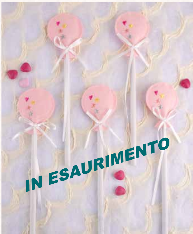
B8 MATITA PALLONCINO ROSA Ultimi 60 pz. disponibili € 3,00 cad.