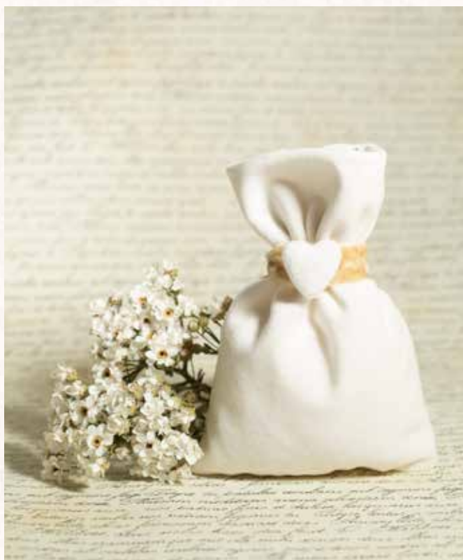
C9 SACCHETTO CUORE VELLUTO Formato 10x13 cm. € 5,00 cad.