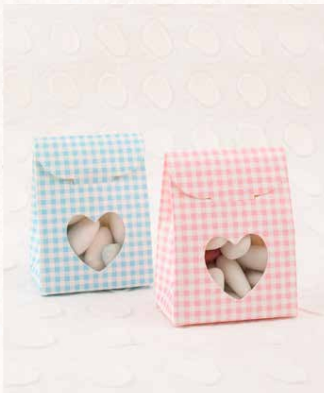
C3-C4 SCATOLINA QUADRETTI Formato 6x3,5x6 cm. € 3,00 cad.