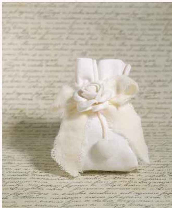
C10 SACCHETTINO ROMANTICO Formato 6x11 cm. € 5,00 cad.