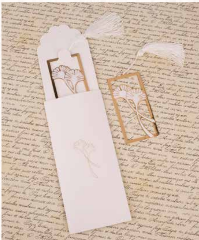
A4 SEGNALIBRO GINKGO BILOBA con packaging incluso € 7,00 cad.