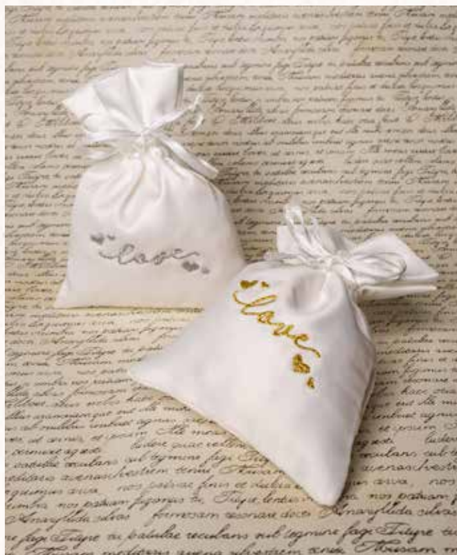
C7 SACCHETTO RASO ARGENTO C8 SACCHETTO RASO ORO Formato 10x13 cm. € 5,00 cad.