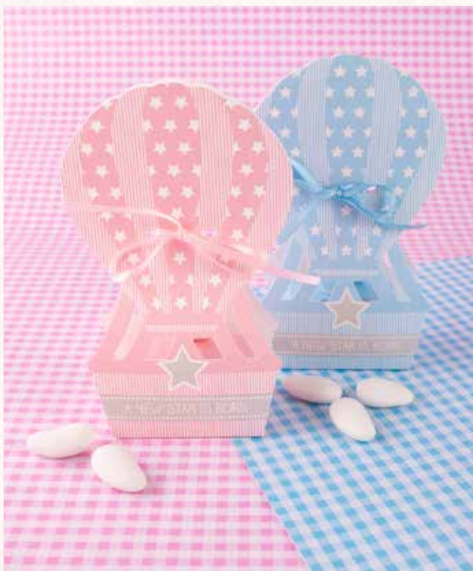
B1-B2 SCATOLINA MONGOLFIERA Formato 6x4x14 cm. € 3,00 cad.