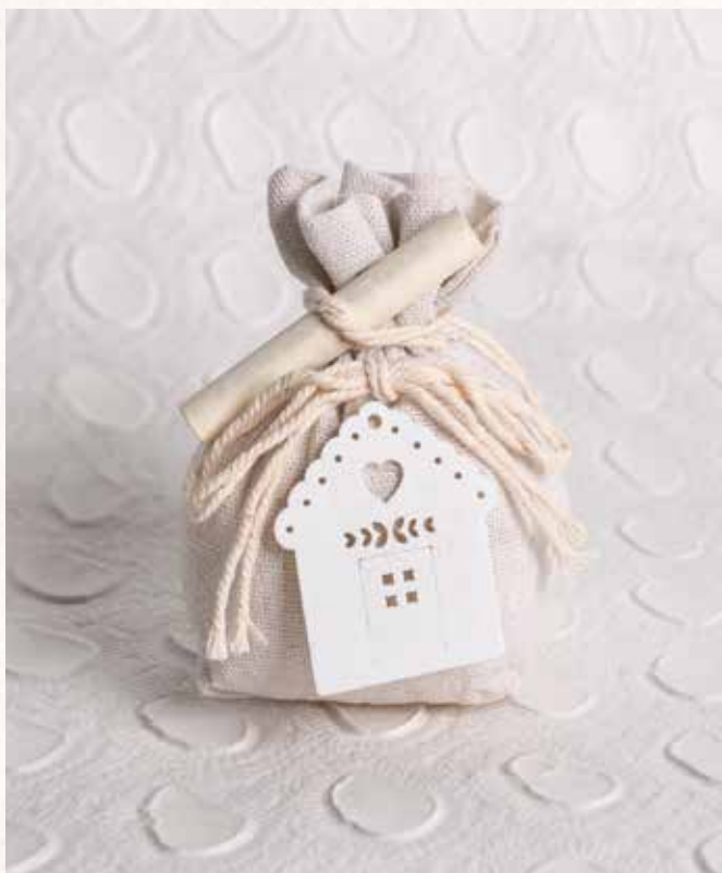
C2 SACCHETTINO con CASETTA Formato 6x10 cm. € 5,00 cad.