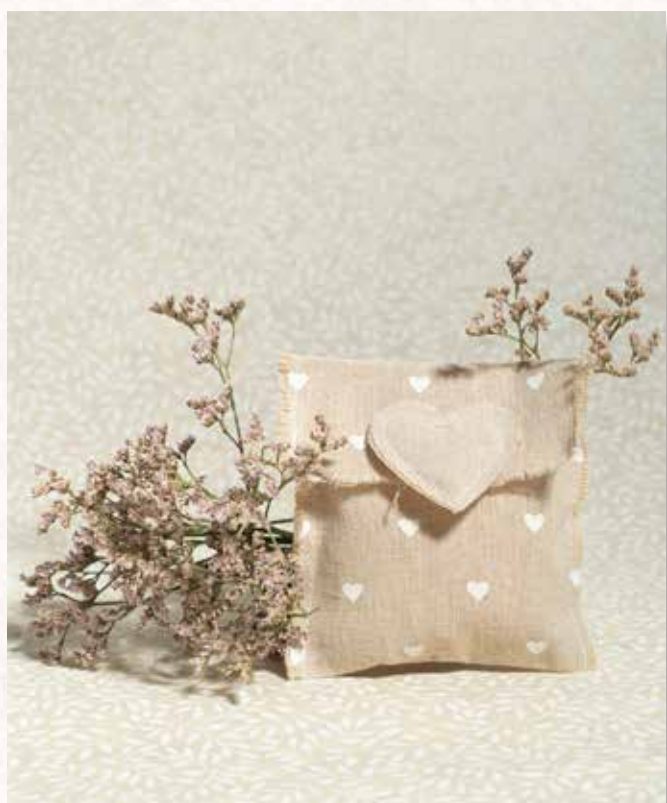
B5 BUSTINA JUTA con CUORE Formato 10x10 cm. € 5,00 cad.