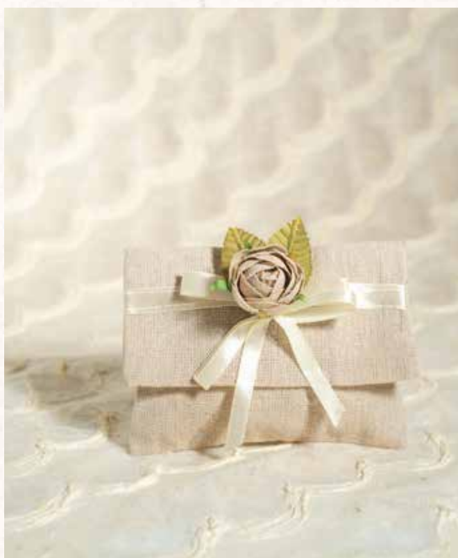
B7 BUSTINA JUTA con ROSA Formato 10x8 cm. € 5,00 cad.