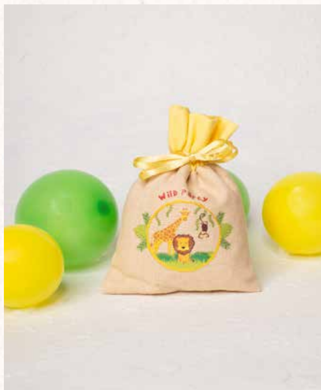
A10 SACCHETTO JUNGLE PARTY Formato 10x13 cm. € 5,00 cad.