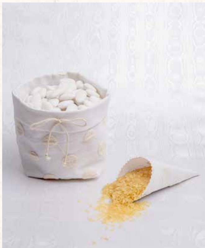
C1 SACCOCCIO per CONFETTI Formato 18x12 cm. € 6,00 cad. C6 CONO PORTA RISO Formato 17 cm. € 2,00 cad.