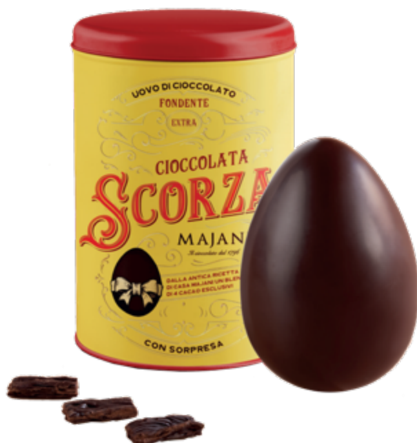
UOVO DI CIOCCOLATO SCORZA FONDENTE EXTRA Donazione minima € 30,00