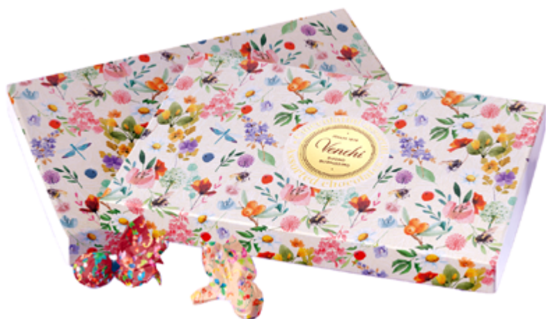
SCATOLA FLOREAL con OVETTI Donazione minima € 18,00