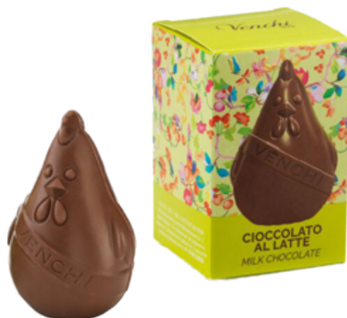
FATTORIA CHIOCCIOTTO AL LATTE Donazione minima € 10,00