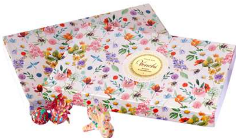
SCATOLA FLOREAL con OVETTI Donazione minima € 18,00