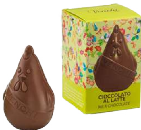
FATTORIA CHIOCCIOTTO AL LATTE Donazione minima € 10,00