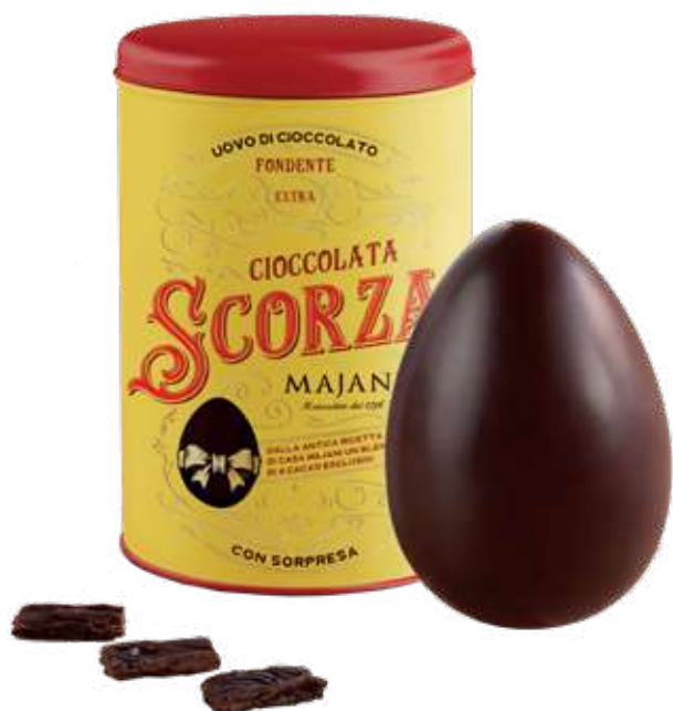
UOVO DI CIOCCOLATO SCORZA FONDENTE EXTRA Donazione minima € 30,00