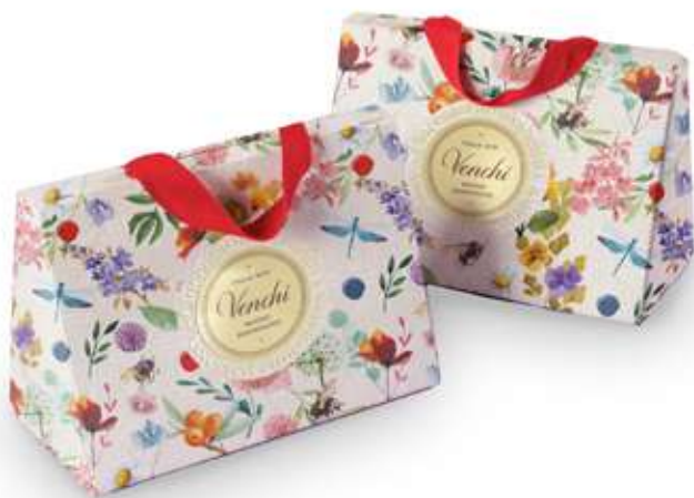
BORSINA FLOREAL con OVETTI Donazione minima € 13,00