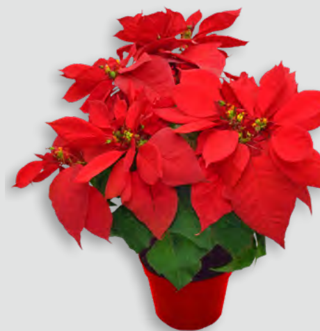
STELLA DI NATALE Cod. 019

FONDAZIONE ANT 1978 ONLUS Assistenza Nazionale Tumori