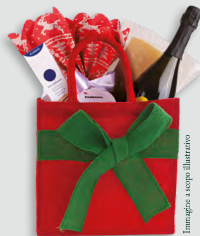
Immagine a scopo illustrativo