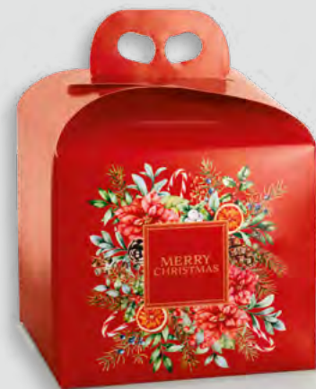
PANETTONE Cod. 016