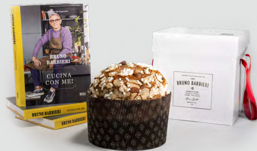
LIBRO+PANETTONE BRUNO BARBIERI PER ANT Cod. 015

Da dieci anni al nostro fianco, anche per Natale 2022 il pluristellato Chef Bruno Barbieri sostiene la nostra missione destinando parte del ricavato dei suoi panettoni e del suo nuovo libro a sostegno di ANT e dei suoi assistiti. Per un Natale a 7 stelle, nel segno della solidarietà!