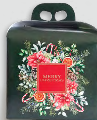
PANDORO Cod. 017