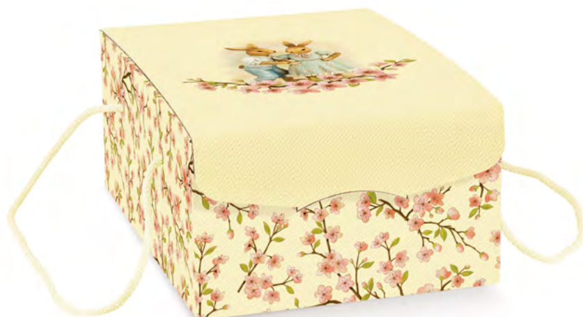
GRAN COLOMBA CLASSICA MAINA ricoperta con glassa alle nocciole, in scatola regalo, 750 g Donazione minima € 16,00