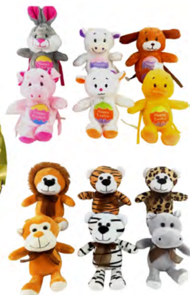
UOVO DI CIOCCOLATO CON PELUCHES al latte o fondente, senza glutine, 225 g Donazione minima € 12,00