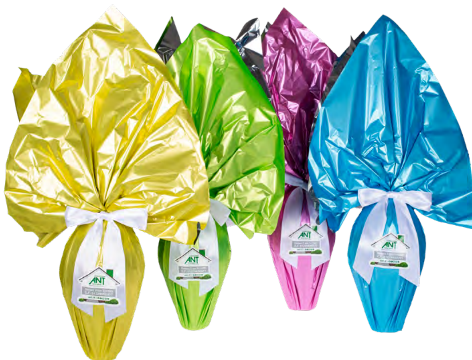
UOVO DI CIOCCOLATO al latte o fondente, senza glutine, 500 g Donazione minima € 16,00