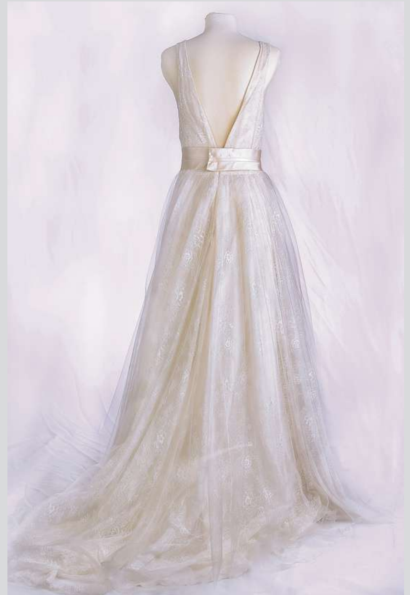
Vestito ricamato con scollo a V e fascia in vita