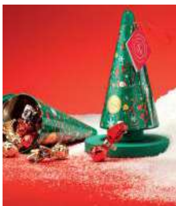
LATTA PINO VENCHI con cioccolatini assortiti