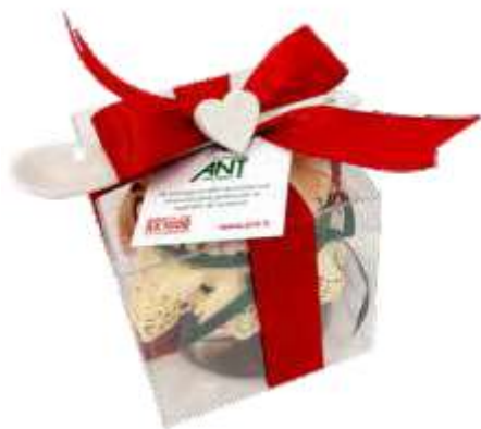
CREMA SPALMABILE LINDT confezione con cucchiaino di ceramica, nocciola o fondente, 200 g