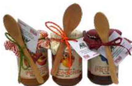
CONFETTURA confezione con cucchiaino legno, confetture extra gusti vari