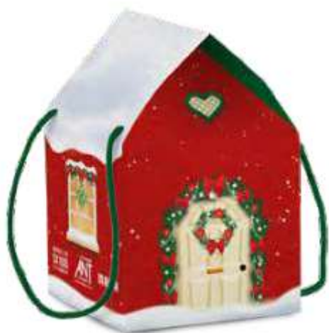
PANETTONE classico Maina, 750g