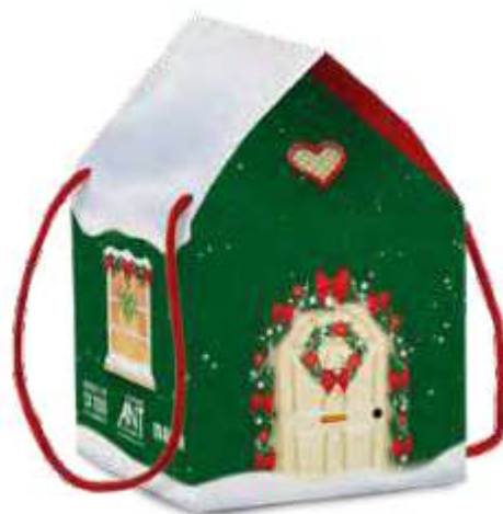
PANDORO classico Maina, 750 g