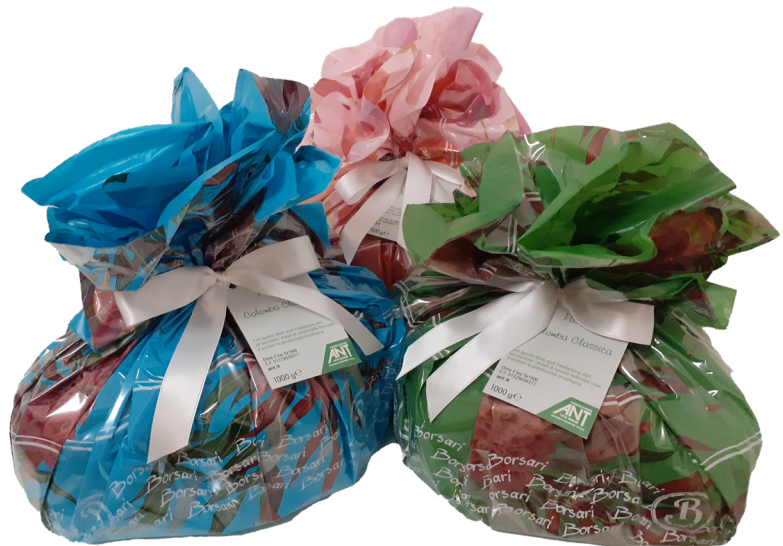
COLOMBA CLASSICA BORSARI 1000 gr Donazione minima € 20,00

I fondi raccolti vanno a sostegno dell'assistenza medico-specialistica domiciliare ai malati di tumore e dei progetti di prevenzione oncologica gratuiti