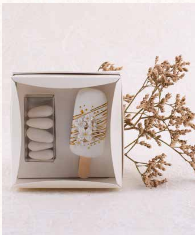
A1 MAGNETE GHIACCIOLO con packaging incluso € 7,00 cad. (l'immagine della confezione è puramente indicativa)