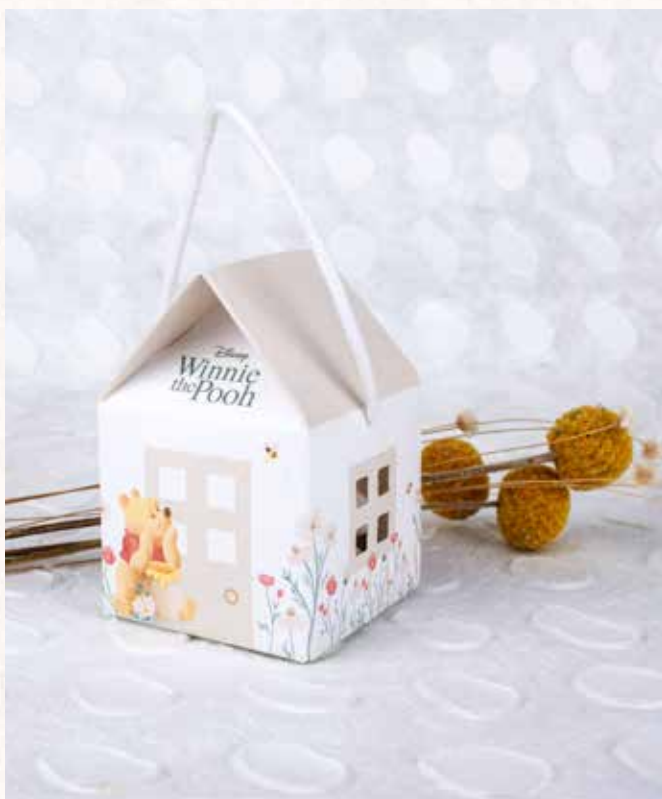
C10 SCATOLINA CASA WINNIE POOH Formato 5,5x5,5x5 cm. € 3,00 cad.