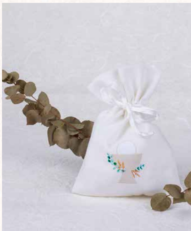
A9 SACCHETTO RELIGIOSO Formato 10x14 cm. € 5,00 cad.