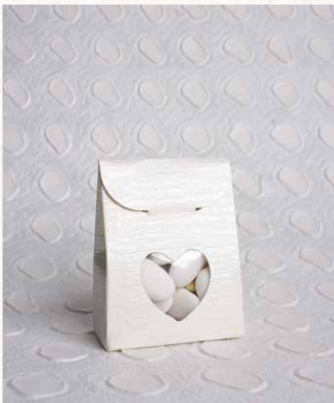
B3 SCATOLINA CUORE AVORIO Formato 6x3,5x6 cm. € 3,00 cad.