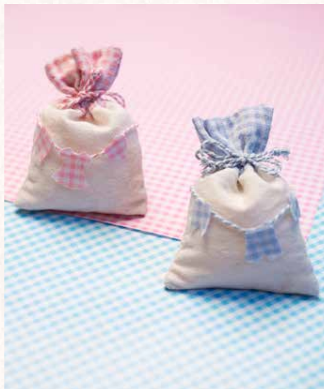
A7 SACCHETTO QUADRETTI Formato 10x13 cm. € 5,00 cad.