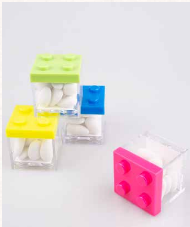
C5 CUBI PORTACONFETTI Formato 5x5x5 cm. € 4,00 cad.