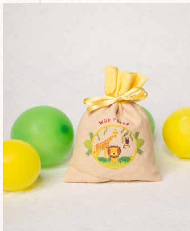
A10 SACCHETTO JUNGLE PARTY Formato 10x13 cm. € 5,00 cad.