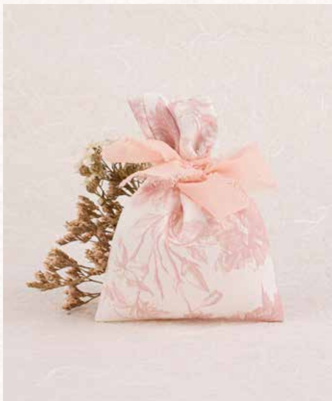
C1 SACCHETTO FRANCESE CIPRIA Formato 10x14 cm. € 5,00 cad.