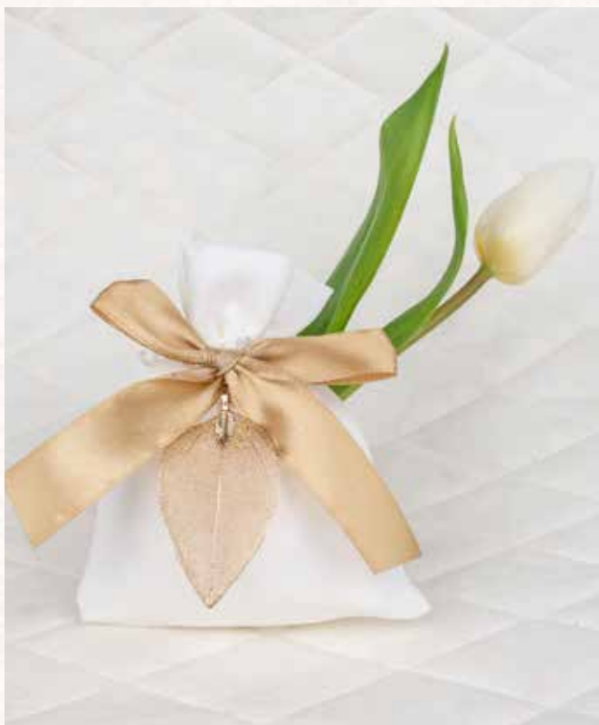
C2 SACCHETTO con FOGLIA Formato 10x12 cm. € 5,00 cad.