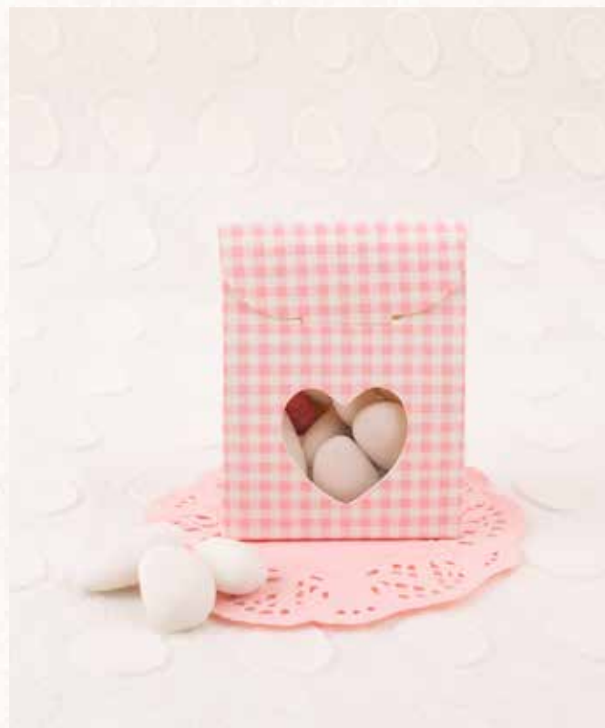
C3 SCATOLINA QUADRETTI ROSA Formato 6x3,5x6 cm. € 3,00 cad.