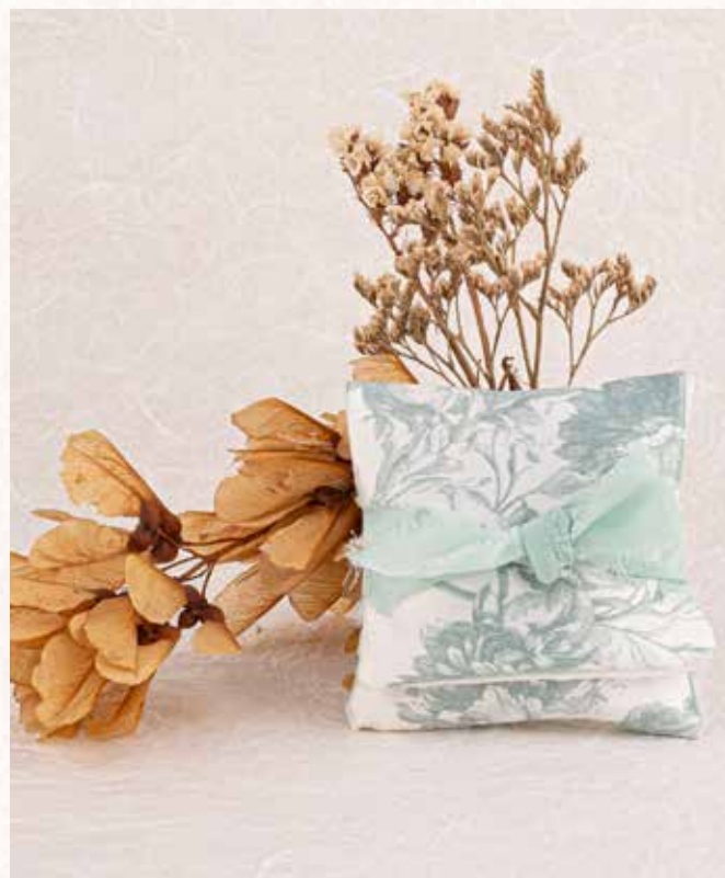
B8 BUSTINA FRANCESE EUCALIPTO Formato 10x8 cm. € 5,00 cad.