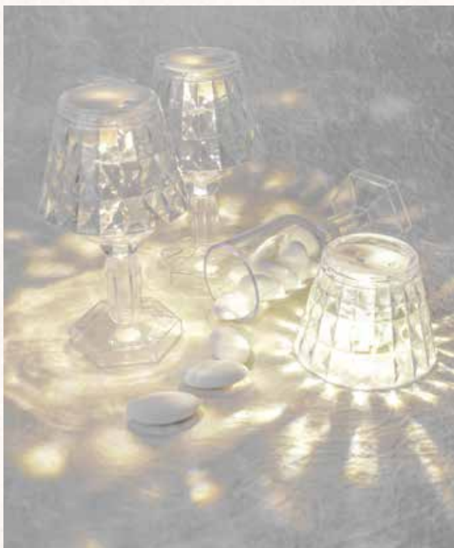
B1 LED LUME PORTACONFETTI H.12 cm. (lucina inclusa) € 6,00 cad. (prodotto non spedibile con corriere)