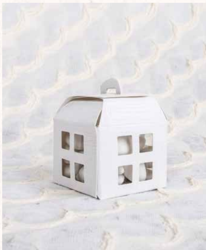
B4 SCATOLINA LANTERNA Formato 5,5x5,5x7,5 cm. € 3,00 cad.