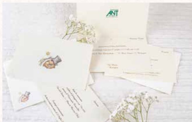
Partecipazioni di Nozze offerta minima 3€ cad.