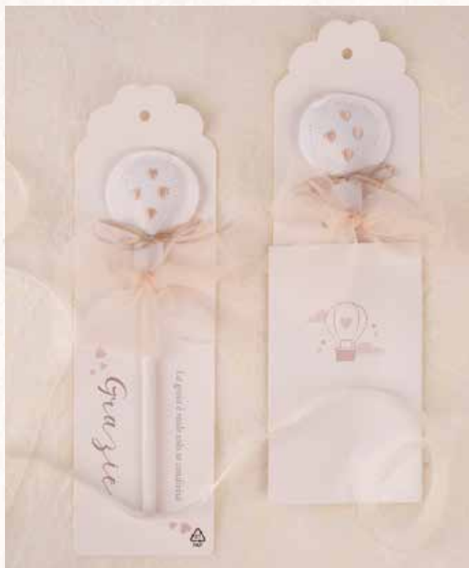
B9 MATITA PALLONCINO BEIGE con packaging incluso € 4,00 cad.