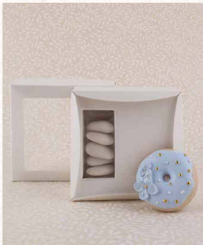
A2 MAGNETE DONUT CELESTE con packaging incluso € 7,00 cad. (l'immagine della confezione è puramente indicativa)