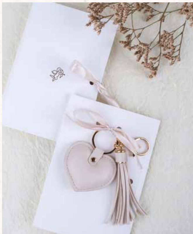
B10 PORTACHIAVI CUORE ECOPELLE con packaging incluso € 8,00 cad.