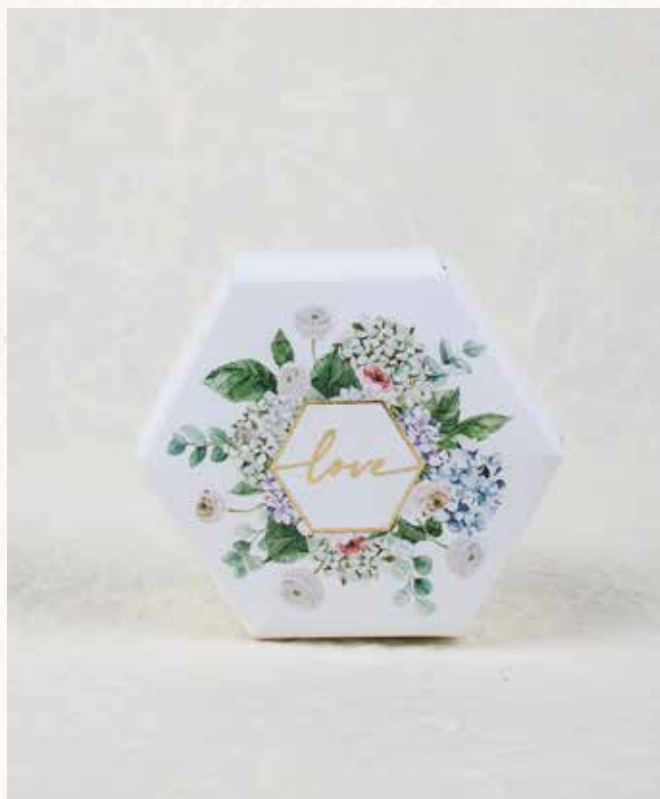
C8 SCATOLINA LOVE Formato 6x4cm. € 3,00 cad.