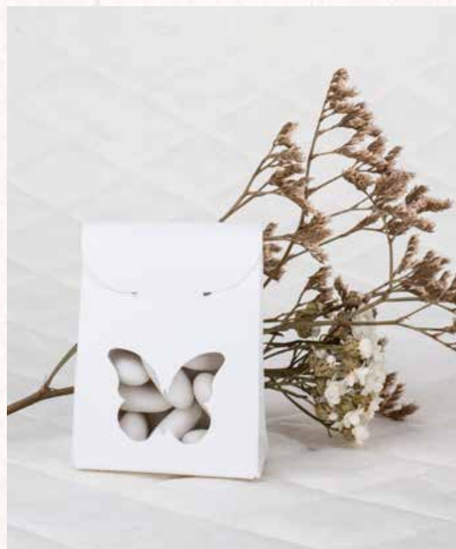
C6 SCATOLINA FARFALLA AVORIO Formato 6x3,5x8 cm. € 3,00 cad.