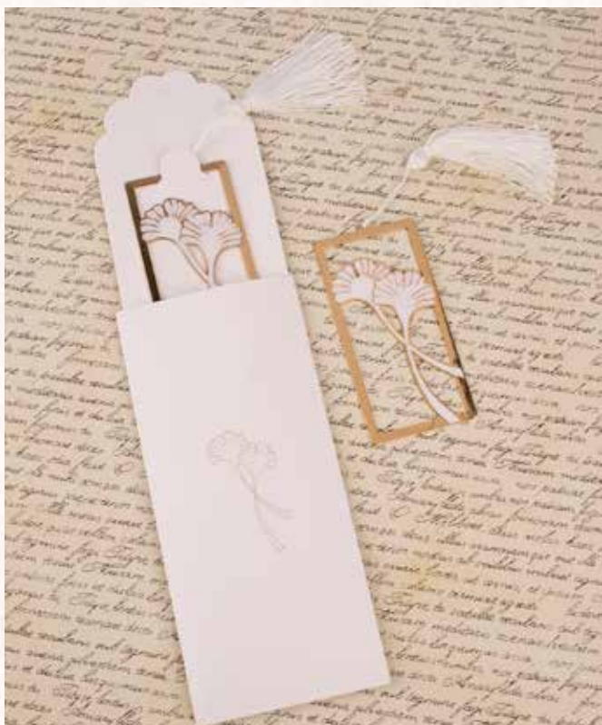
A4 SEGNALIBRO GINKGO BILOBA con packaging incluso € 7,00 cad.