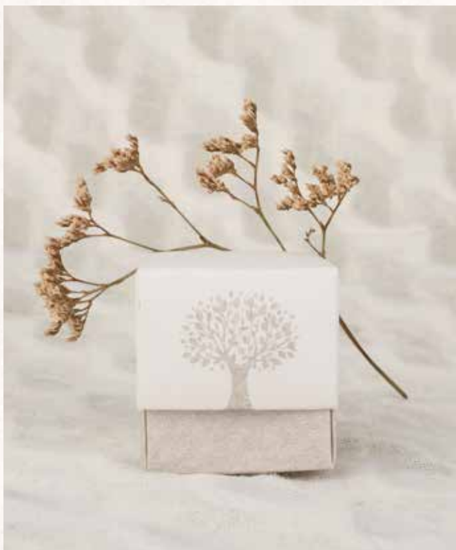
C4 SCATOLINA ALBERO VITA Formato 5x5x5 cm. € 3,00 cad.