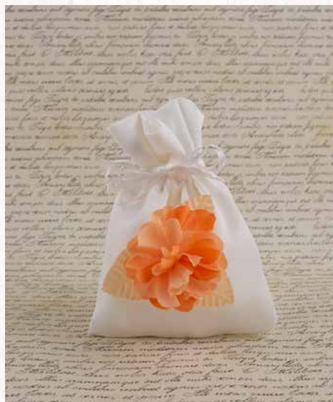
B6 SACCHETTO MARRAKECH Formato 10x14 cm. € 5,00 cad.