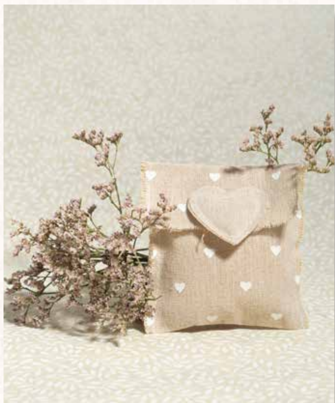
B5 BUSTINA JUTA con CUORE Formato 10x10 cm. € 5,00 cad.