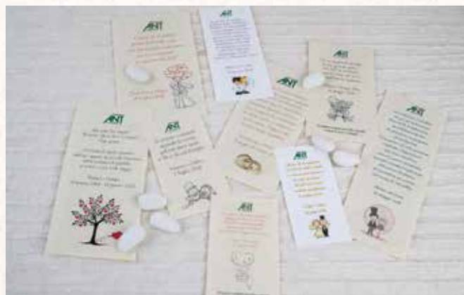
Pergamene personalizzate offerta minima 1€ cad.