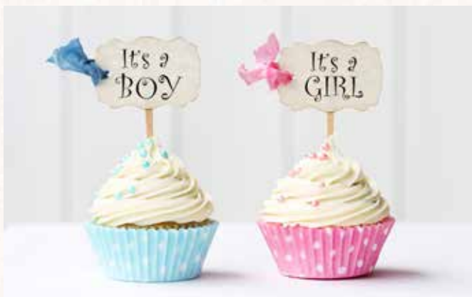
Battesimo e Nascita