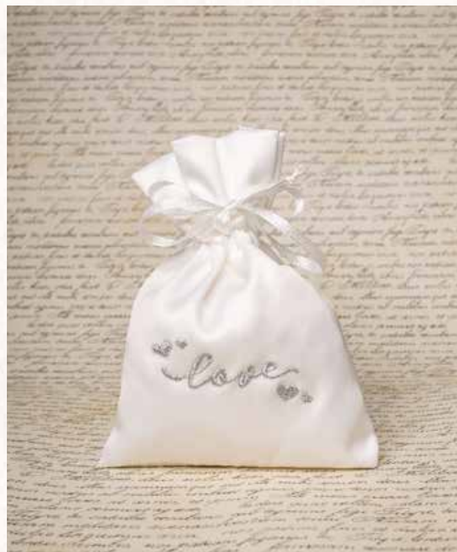
C7 SACCHETTO RASO ARGENTO Formato 10x13 cm. € 5,00 cad.