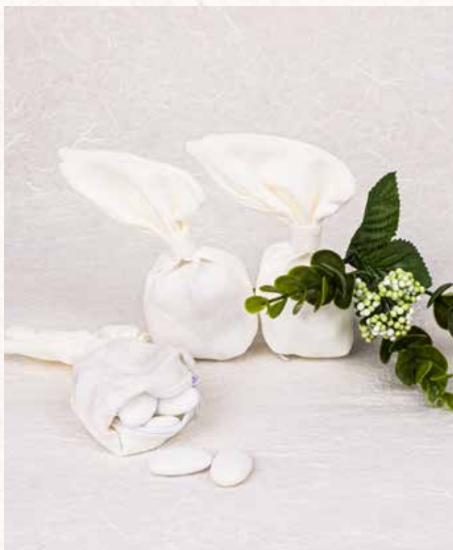
B7 SACCHETTINO con NODO Formato 13 cm. € 5,00 cad.