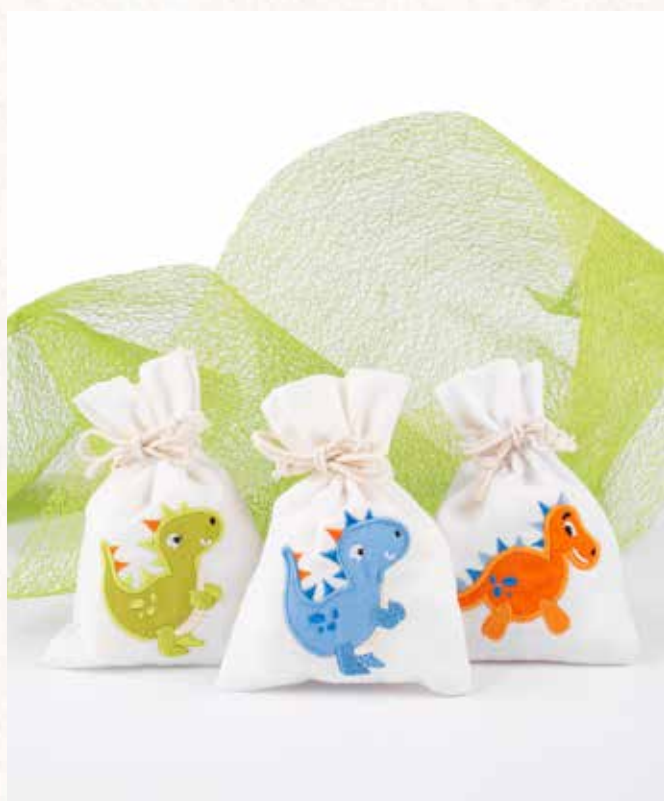
A5 SACCHETTO DINOSAURI Formato 10x14 cm. € 5,00 cad.