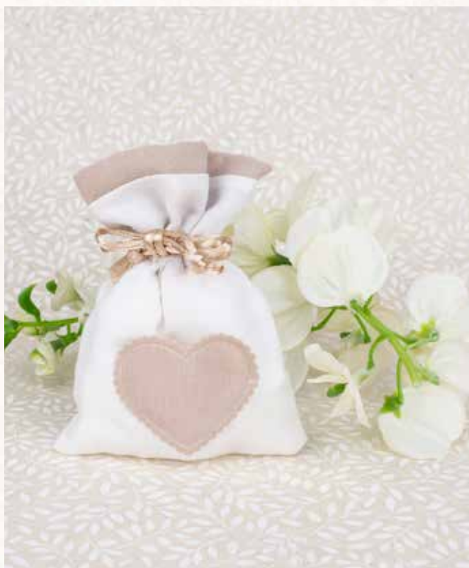
C9 SACCHETTO con CUORE Formato 10x13 cm. € 5,00 cad.