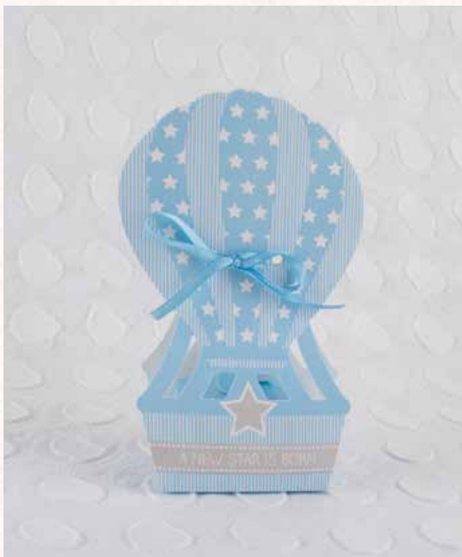
B2 SCATOLINA MONGOLFIERA Formato 6x4x14 cm. € 3,00 cad.