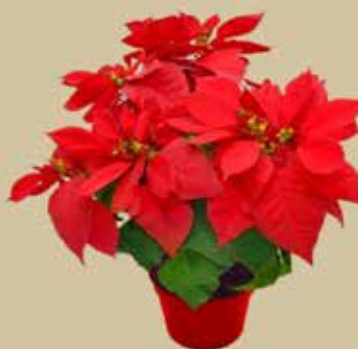
Stella di Natale

SCANSIONA IL QR CODE PER SCOPRIRE COME E DOVE TROVARE I NOSTRI PRODOTTI